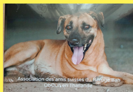
Association des amis suisses du Refuge Ban Oboun, en Thaïlande

Pour vos dons : Association des amis suisses du refuge Ban Oboun BCV Cpte No. L5328.45.94 IBAN CH26 0076 7000 L532 8459 4