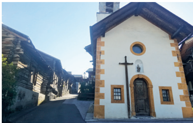
Une vue du vieux village de Haute-Nendaz et de sa chapelle du XV e siècle. J'aime particulièrement le traverser, m'imaginer ses habitants d'autrefois mais aussi toutes les belles choses qui restent à y faire.