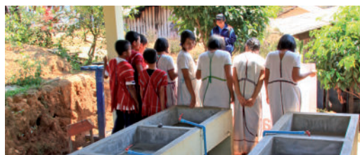
Aménagement de lavoirs dans une école des tribus montagnardes

Fondation Jan & Oscar Route de la Petite-Corniche 2 1091 Aran Suisse T. + 41 76 393 20 22 admin@fondationjan-oscar.ch www.fondationjan-oscar.ch