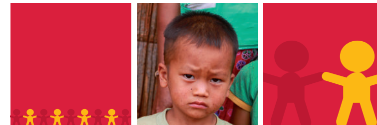
Nouveau bâtiment pour l'ophelinat Sarnelli (Nong Khai, 2008)

... et aussi, des installations d'eau potables et des citernes, cuisines et équipements, bibliothèque et livres.